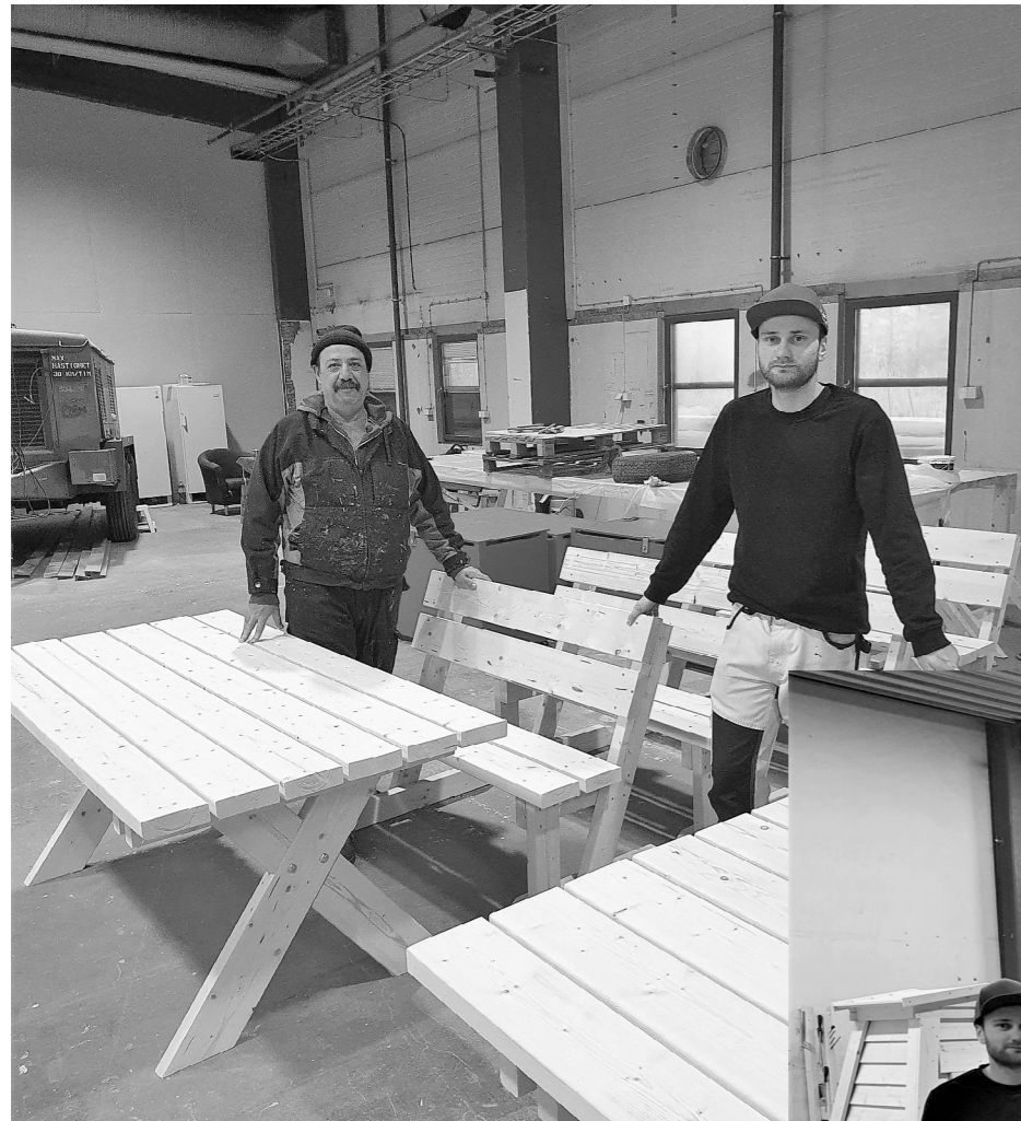
Nya produkter för hösten är kompakta trädgårdsmöbler samt rastplatsbord med tak.