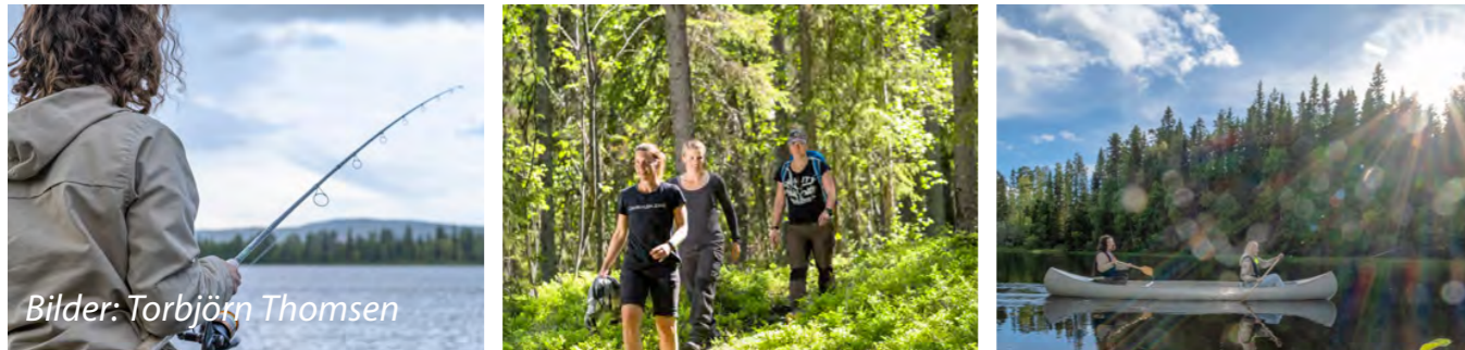
Bilder: Torbjörn Thomsen