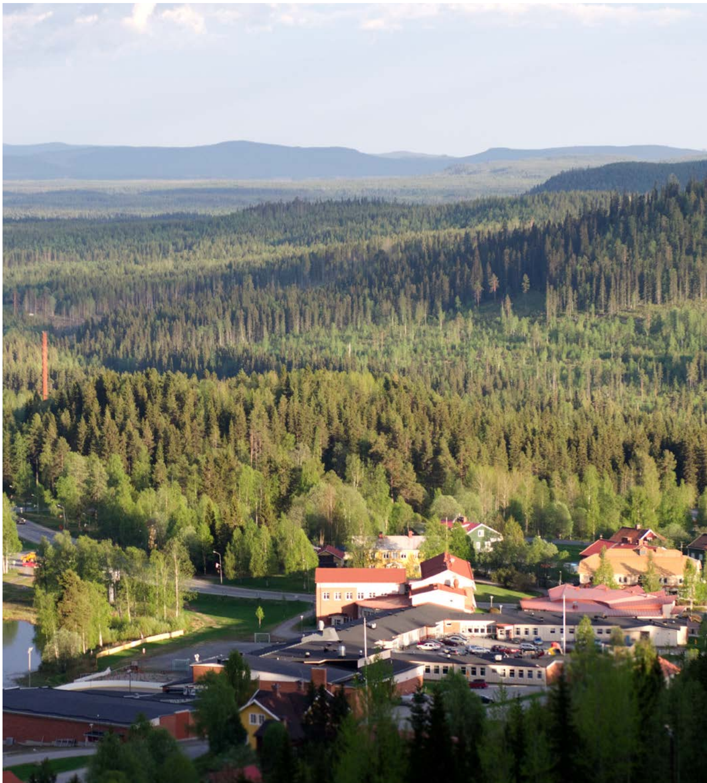
Dorotea kommun är till ytan lika stort som landskapet Blekinge och har idag ca 2800 invånare.