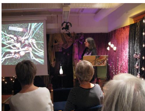
Föreläsning för allmänheten på biblioteket