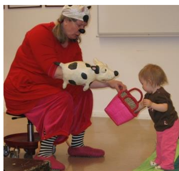
Barnföreställning för de minsta