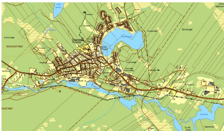
Bild 2. Dorotea samhälle

Den mest trafikerade vägen i Dorotea är E 45 som löper genom samhället. Enligt Trafikverket har vägen ett teoretiskt medeldygnslöde på 1940 fordon. Genom samhället heter E 45an Storgatan. Ca 1,2 km av vägsträckan har fasader på båda sidor (bild 2). Gaturummet är öppet och antalet bostadshus är begränsat, det finns ett antal verksamhetslokaler längs vägen. Fasaderna ligger på 7-30 meter från vägen men är relativt glest utspridda, vilket gör att bedömningen är att gatan bedöms som ventilerad.